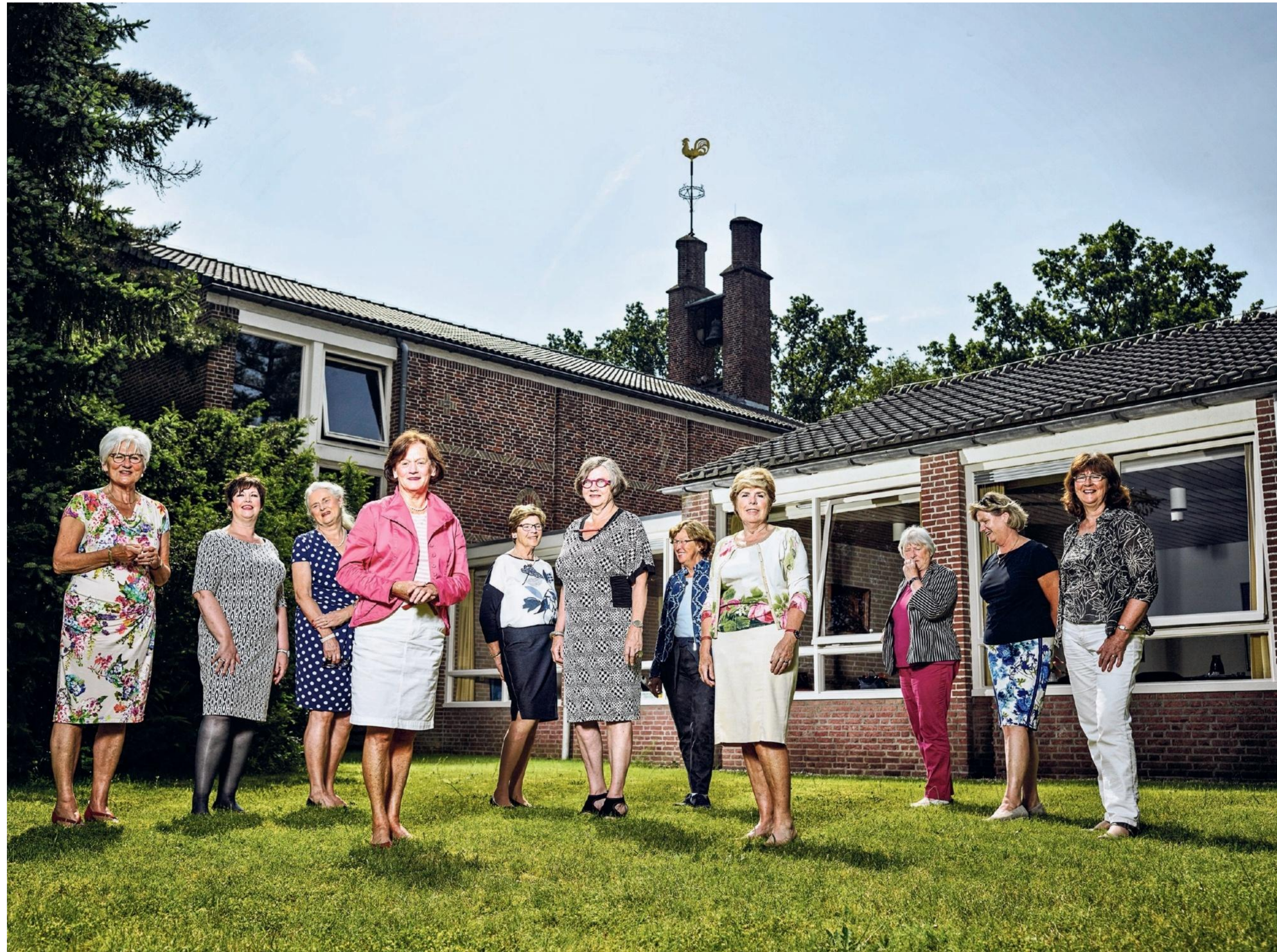
De Geinige Gulden uit Waalre is de oudste nog actieve beleggingsclub van Nederland. Vorig jaar boekte de club een rendement van 13,5 procent.

Minder clubs dus, maar aan de naamgeving wordt nog steeds veel aandacht besteed. Duitenberg, De Boterham, Het